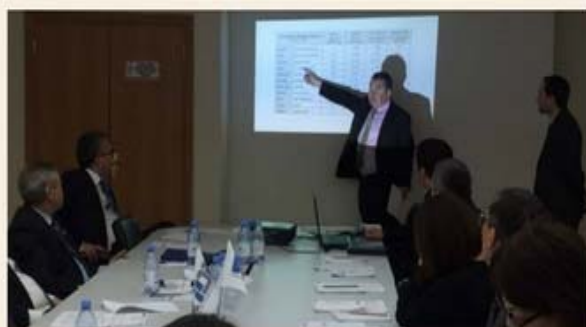
Представители Министерства энергетики Республики Казахстан (орган, ответственный за развитие национальных кластеров), Министерства культуры и спорта Республики Казахстан (орган, ответственный за развитие туризма), ОЮФЛ «Союз птицеводов Казахстана», ОИПЮЛ «Мясной союз Казахстана», Metropolitan Tourism Association (представительство в Астане), ОЮЛ «Союз машиностроителей Казахстана».

Для участия в конкурсе приглашаются все заинтересованные ассоциации, группы компаний и другие стороны, представляющие цепочку добавленной стоимости. Все участники должны представить заполненные заявки на конкурсный отбор кластеров в Министерство по инвестициям и развитию РК (в департамент стратегического планирования) до 8 июня 2017 года.