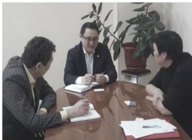
Представители АО «КИРИ» во время поездки в Северный Казахстан