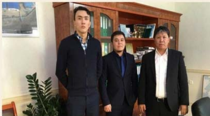
Представители АО «КИРИ» во время поездки в Караганду