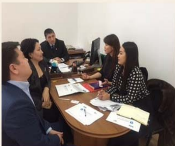
Представители АО «КИРИ» во время поездки в Актау