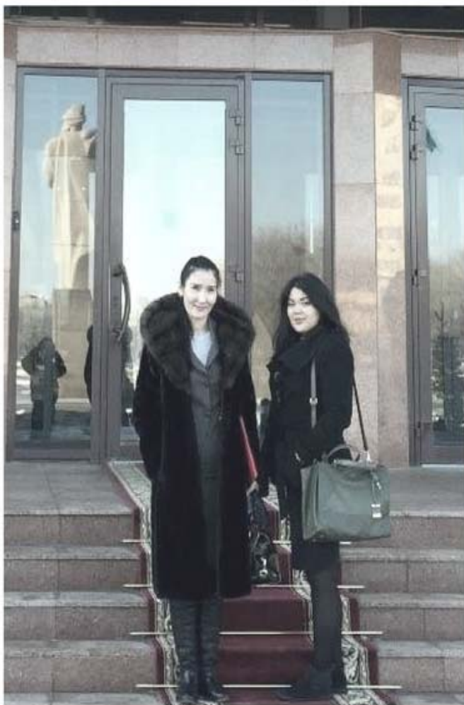
Представители АО «КИРИ» во время поездки в Атырау

Все встречи вызвали значительный интерес со стороны всех участников и оказались такими же полезными, как и предыдущие, с точки зрения понимания правил отбора кластеров, основных критериев отбора и вопросов о процессе и о проекте, на которые во время каждой встречи ответили представители АО «КИРИ».