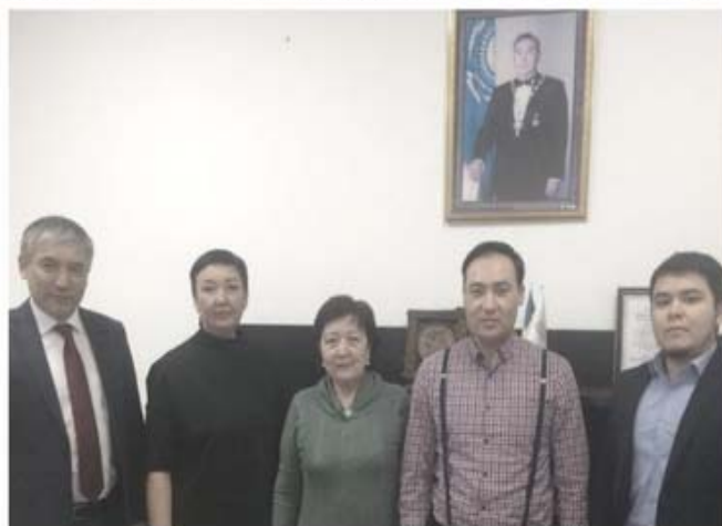
Представители АО «КИРИ» по время поездки в Южный Казахстан ТЕРРИТОРИАЛЬНЫЕ КЛАСТЕРЫ // 7