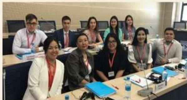
Модуль «Кластерная экономика и отбор кластерных инициатив»

В течение первого модуля были проведены лекции и дополнительные обсуждения темы «Кластерная экономика и отбор кластерных инициатив» на основе анализа конкретных ситуаций. На вечерних занятиях давались конкретные примеры с учетом особенностей, потребностей и проблем Казахстана по темам, изученным на утренних занятиях. На протяжении всего обучения теоретические аспекты сочетались с интерактивным подходом, что сделало процесс обучения максимально живым и плодотворным.