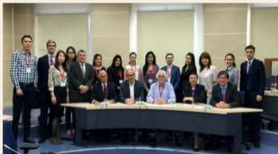
Представители АО «КИРИ», ЕФСК и компании COMPETITIVENESS.

В течение первого модуля были проведены лекции и дополнительные обсуждения темы «Кластерная экономика и отбор кластерных инициатив» на основе анализа конкретных ситуаций. На вечерних занятиях давались конкретные примеры с учетом особенностей, потребностей и проблем Казахстана по темам, изученным на утренних занятиях. На протяжении всего обучения теоретические аспекты сочетались с интерактивным подходом, что сделало процесс обучения максимально живым и плодотворным.