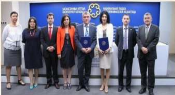
Меморандум о взаимопонимании и сотрудничестве

26 июня в НПП РК «Атамекен» состоялось подписание Меморандума о взаимопонимании и сотрудничестве между АО «Казахстанский институт развития индустрии» (АО «КИРИ») и Национальной палатой предпринимателей «Атамекен».