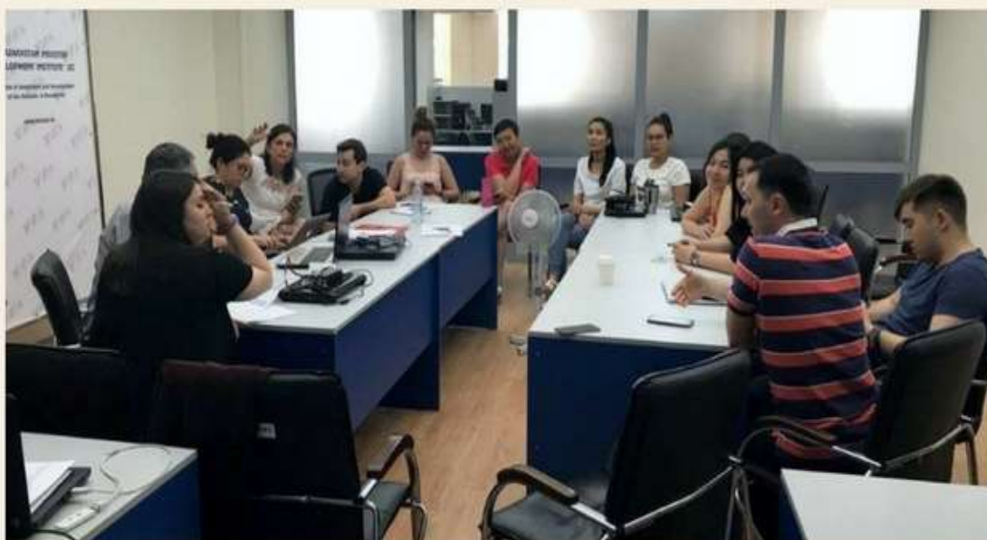
Совещание сотрудники АО «КИРИ» и «INFYDE» касательно методики отбора территориальных кластеров

В результате совместной работы была собрана необходимая информация для оценки заявок, обсуждены основные подходы и принципы механизмов государственной поддержки кластерных инициатив и обсужден план работы на ближайшее будущее. Проект реализуется в рамках компонента кластерного развития государственной программы индустриально-инновационного развития (ГПИИР). Организатором конкурса выступает Министерство по инвестициям и развитию Республики Казахстан, а оператором назначено АО «КИРИ». После проведения процедур отбора Комиссия по промышленному развитию Республики Казахстан при Премьер-Министре РК определит 6 пилотных территориальных кластеров. Затем команда АО «КИРИ» совместно с INFYDE в 2017-2019 гг. приступит к реализации мероприятий, запланированных по Проекту.